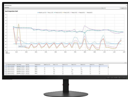
Valvo tuotteiden lämpötilaa reaaliajassa.